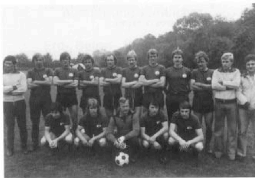
Gewinner des Pfingstturniers 1977 in Berkheim