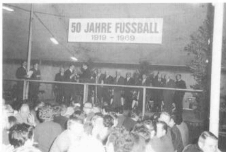
Erinnerungen an das 50jährige Jubiläum, hier die Ehrung der Gründer, im Festzelt auf dem alten Sportplatz