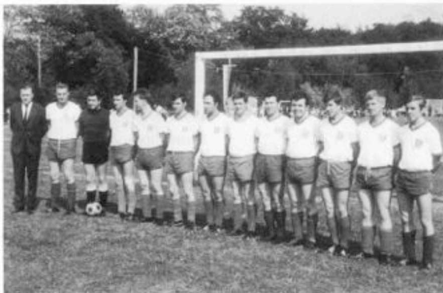
I. Mannschaft im Jubiläumsjahr 1969

Hauptstraße 18 7300 Esslingen-Zell Telefon (07 11) 36 60 51