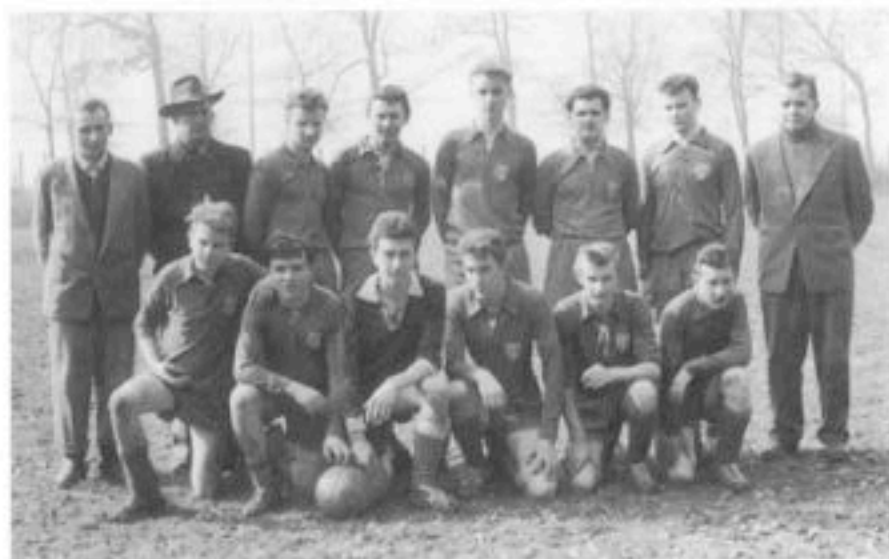
A-Jugend Bezirksmeister 1958/59